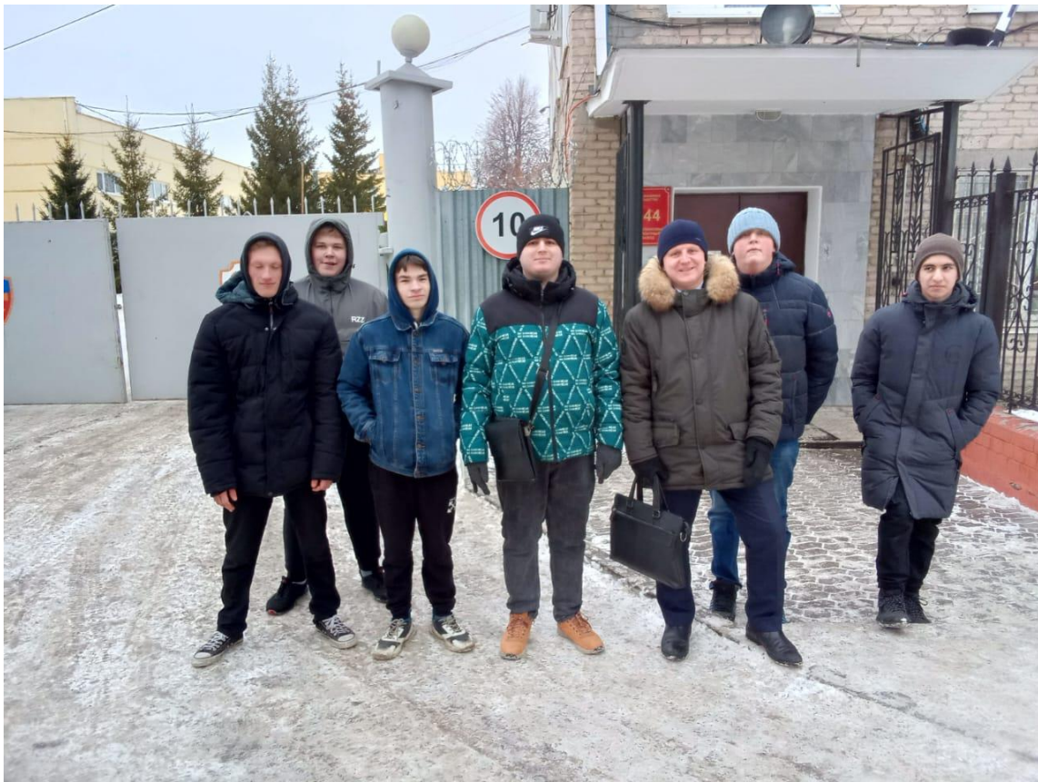
Экскурсия на АО «144 Бронетанковый ремонтный завод»