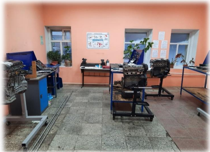
Мастерская по сборке узлов