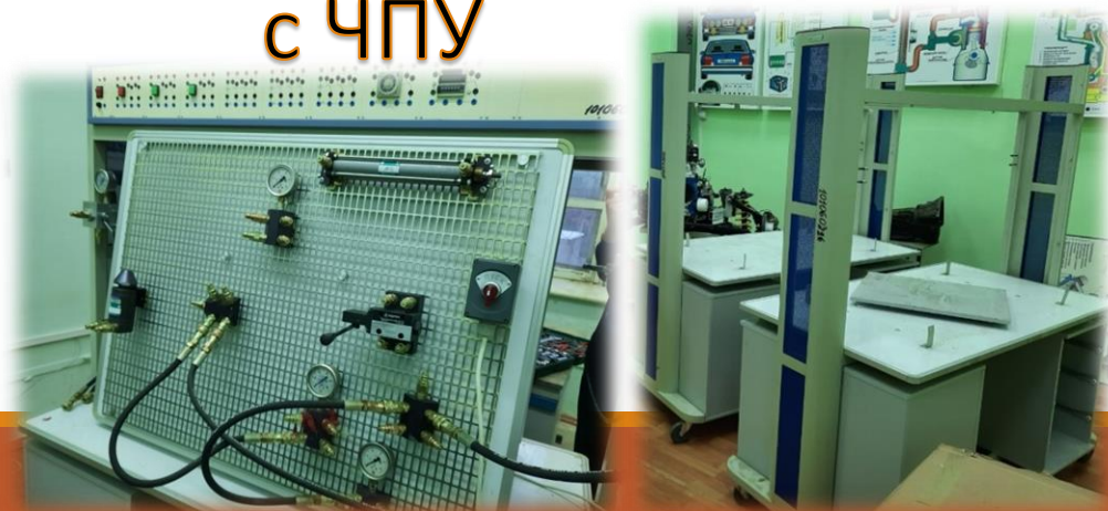
Лаборатория пневматических и гидравлических стендов